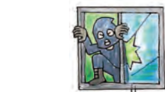
●盗難によって発生したき損・汚損 (盗難そのものの被害は除きます。)