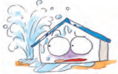
●給排水整備に発生した事故に伴う漏水等 (自然災害を除きます。) ※水ぬれ損が発生した場合に限ります。