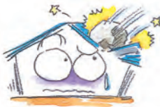
●建物外部からの物体の落下、衝突等 (自然災害を除きます。)